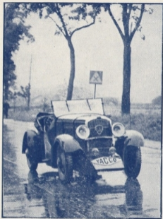
La 301 PEUGEOT-YACCO sur la route.